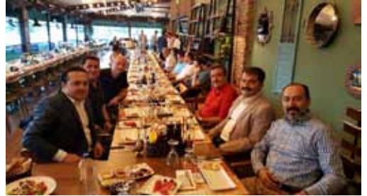
• KÜTAHYA VET. HEK. ODA İFTARINA KATILIM