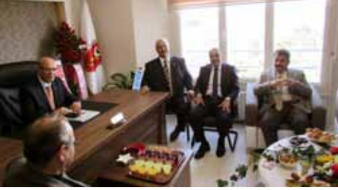
• BALIKESİR VHO AÇILIŞI