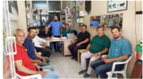
• M.K.Paşa Meslektaşlarımızı Ziyaret Ettik