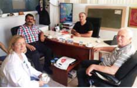
• CP Ziyareti