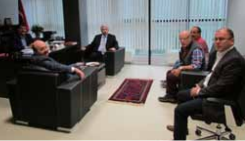
• BALIKESİR VHO ZİYARETİ