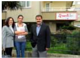
Vet.Hek.Sena BİLGİN/SENAVET Veteriner Muayenehanesi