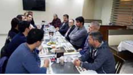
• Karacabey ve M.Kemalpaşa Bölgesi Çiftlik Veteriner Hekim Toplantısı