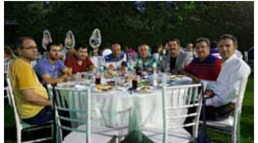
• BALIKESİR VET. HEK. ODA İFTARI