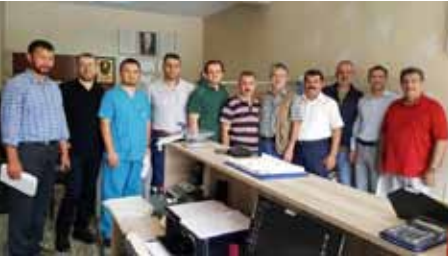
• Yenişehir Meslektaşlarımızı Ziyaret Ettik