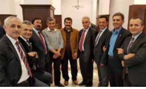
• TVHB ODA BAŞKANLARI TOPLANTISI